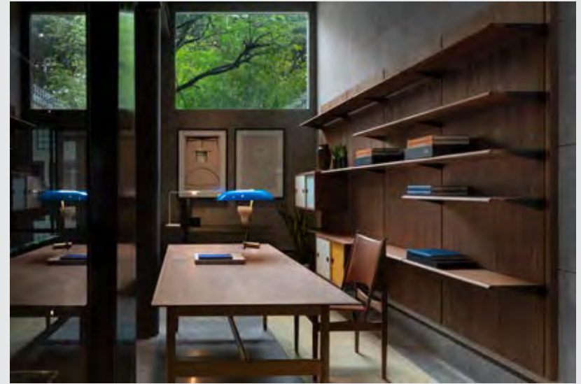
↑ Finn Juhl ฐู Panel System

นอกจากนี้ ผลงานอื่นๆ ของ Finn Juhl ทั้ง Pelican Chair (1940) และ Poet Sofa (1941) ยังได้รับการขนานนามว่าเป็นการออกแบบที่เข้าถึงจิตวิญญาณของมนุษย์อย่างแท้จริง โดยเริ่มต้นจากการวัดสัดส่วนร่างกายของเขาเอง นำไปวิเคราะห์แล้วออกแบบส่วนประกอบของเก้าอี้ในรูปแบบที่ไม่มีข้อจำกัดใดๆ โดยเฉพาะ Poet Sofa ที่ได้รับการออกแบบให้เป็นโซฟาสองที่นั่งขนาดเล็กที่มีความเชื่อมโยงระหว่างงานเฟอร์นิเจอร์และงานประติมากรรม แต่ที่พิเศษไปกว่านั้นก็คือความสบายของการใช้งานที่โอบกอดคนสองคนไว้ด้วยกัน