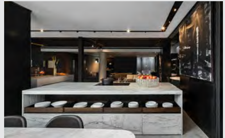
↑ Eggersmann รุ่น Unique

เป็นชุดครัวระดับมาสเตอร์พีซ ที่ได้รับรางวัล Good Design Award จาก Chicago Atheneum: Museum of Architecture and Design ความพิเศษอยู่ที่ การออกแบบโดยใช้จุดหมุนแทนการเปิดปิดด้วยบานพับ ตามปกติ เป็นการเพิ่มความสะดวกสบายในการใช้งาน เป็นพิเศษ