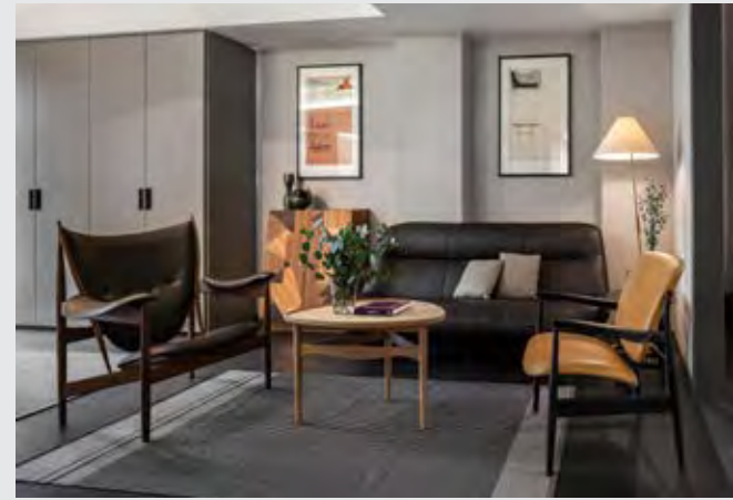
↑ Finn Juhl ชุด Chieftain Chair