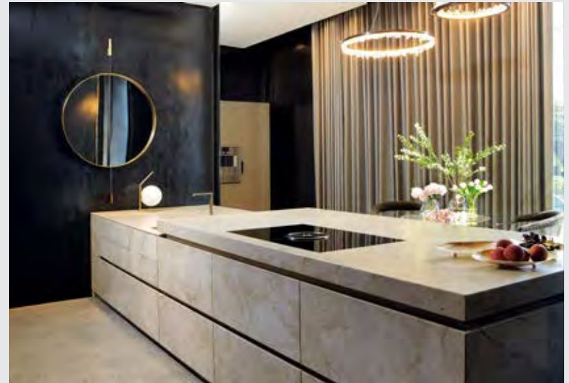
↑ Eggersmann รุ่น Unique