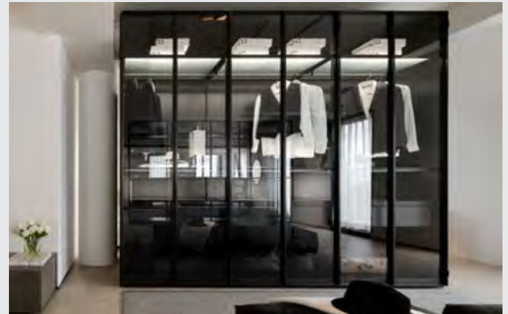
↑ ตู้เสื้อผ้า Porro รุ่น Air