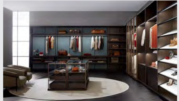
↑ ตู้เสื้อผ้า Porro Storage