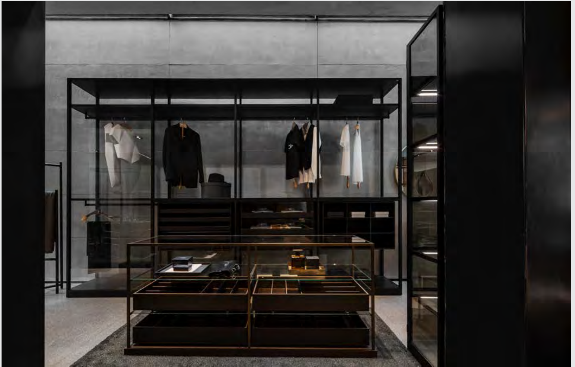
↑ គំរូឆែងប្រាក់ Porro រុំ Air