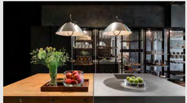
↑ Eggersmann รุ่น Work Turn