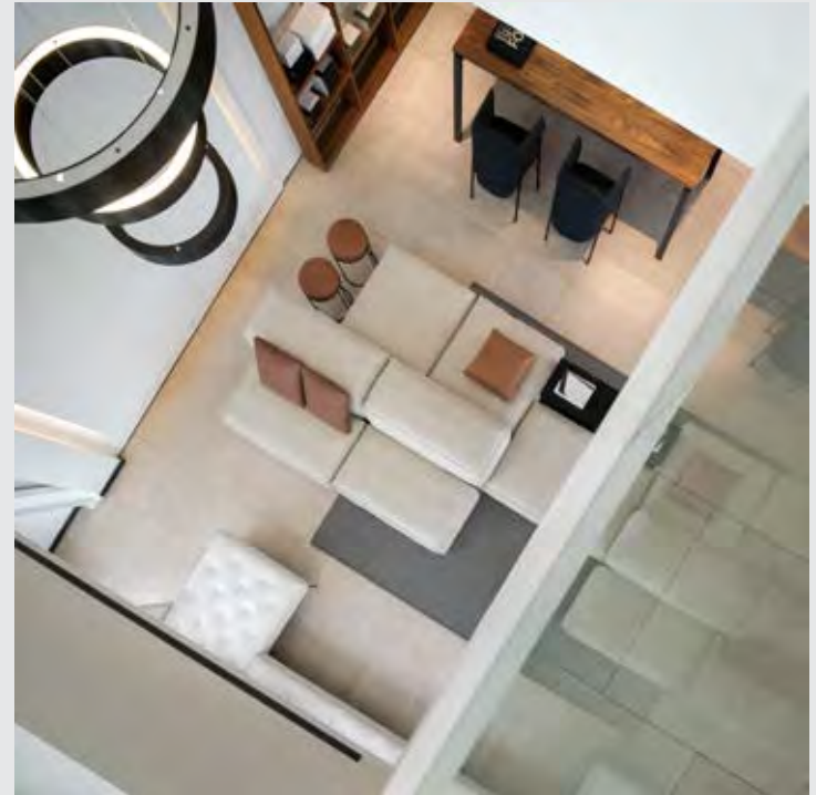
↑ Extrasoft Sofa