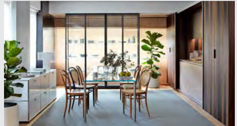
↑ Eggersmann รุ่น Bespoke Kitchen