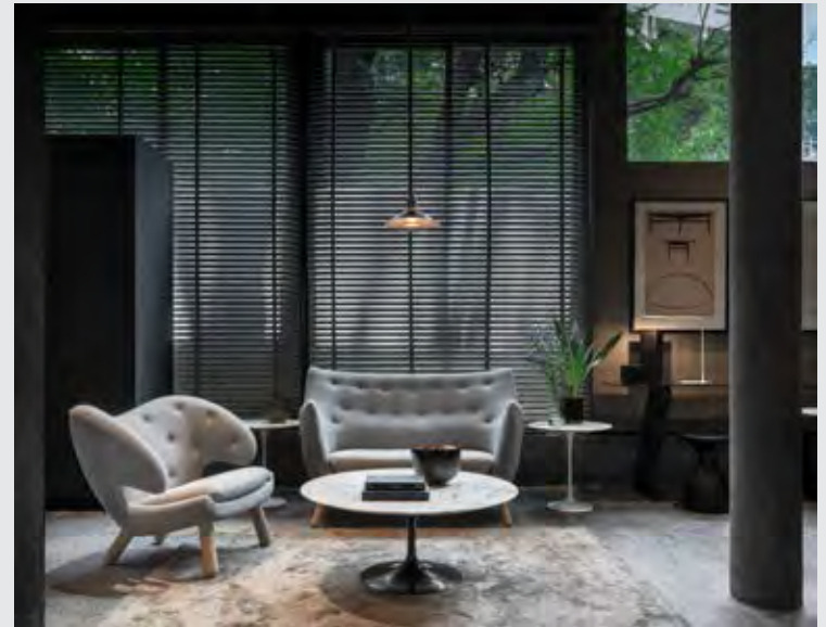
↑ Finn Juhl ฐู Poet sofa