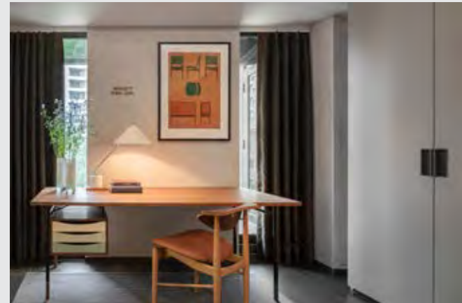
↑ Finn Juhl ชุด Nyhavn Desk