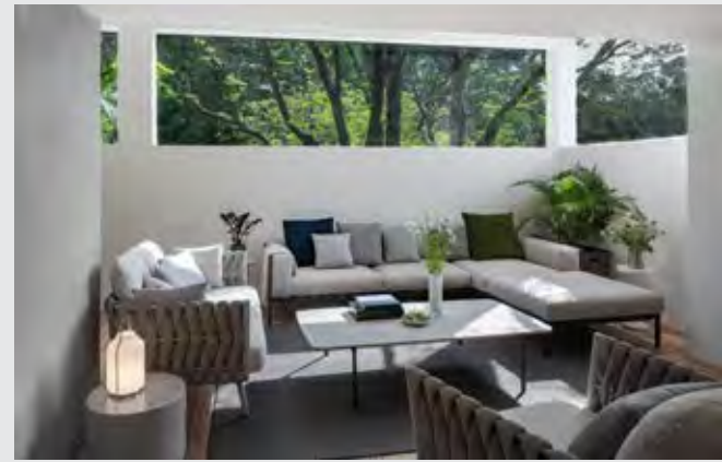
↑ โซฟา Tribù

Nyhavn Desk: โต๊ะที่ได้รับการออกแบบในปี 1945 โดยได้ชื่อมาจากสตูดิโอแรกๆ ของ Finn Juhl ที่อยู่ใจกลางเมืองโคเปนเฮเกน และเป็นจุดเริ่มต้นที่ทำให้เขาได้เก็บเกี่ยวประสบการณ์การทำงานกับโครงการที่สำคัญระดับประเทศ อาทิ Danish Broadcasting House และสนามบินโคเปนเฮเกน