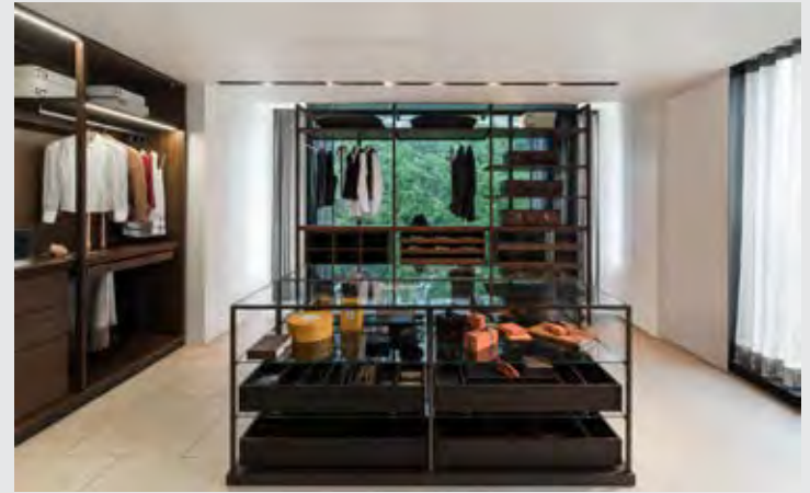
↑ Porro Island รุ่น Acquario

พิเศษด้วยเทคโนโลยี self-standing ที่สามารถช่วยให้ ตั้งตู้เสื้อผ้าไว้กลางห้องได้อย่างมีสไตล์ กับนวัตกรรม ทางด้านการออกแบบที่เปิดโอกาสให้ลูกค้าสามารถเลือก กรอบบาน (เหล็กหรือทองเหลืองปิดแปร่ง) และหน้าบาน (กระจกใส crystal clear glass หรือกระจกขุ่น smoke glass)